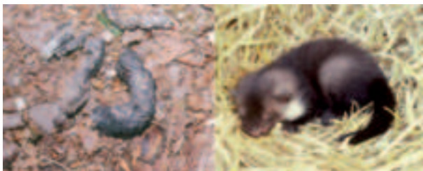
Jungmarder im Stroh